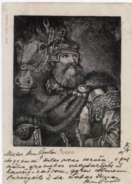
Lietuvos didysis kunigaikštis Kęstutis. Apie 1904

Palanga įsikūrusi Baltijos pajūryje, palei nedidelio Rąžės* upelio žiotis. Lietuvių archeologai šioje vietoje aptiko įrodymų, kad joje gyventa jau neolito periodu 1 . Jiems taip pat pavyko rasti aiškių pėdsakų, kad X–XIII a. čia būta gyvenvietės, išsidėsčiusios jūrinėje terasoje Birutės kalno papėdėje į pietus nuo upelio, taip pat kalno viršūnėje buvusių medinių įtvirtinimų liekanų.