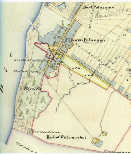
o Tyszkiewicziaus Palangos valdų plano fragmentas. 1867