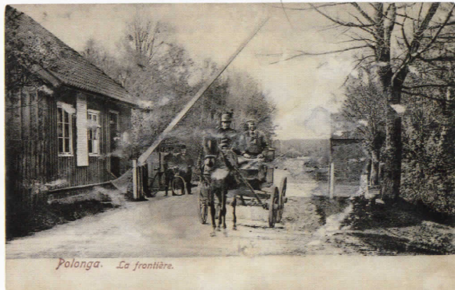
Sienos perėjimo punktas prie Palangos. Apie 1907