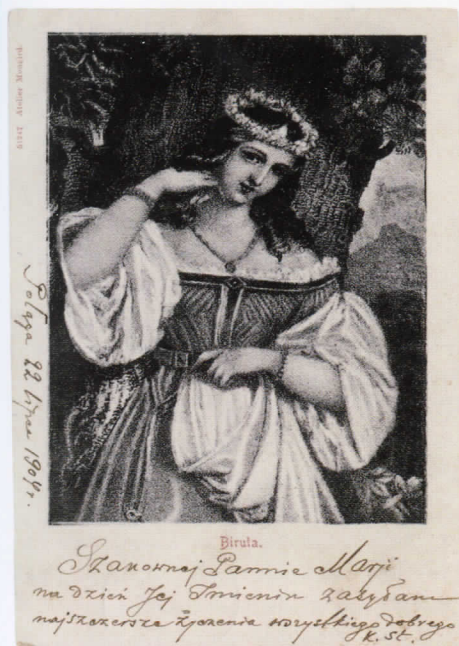
Lietuvos didžiojo kunigaikščio Kęstučio žmona Birutė. Apie 1904