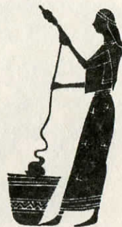
Verpėja. Piešinys ant vazos. IV a. pr. Kr.