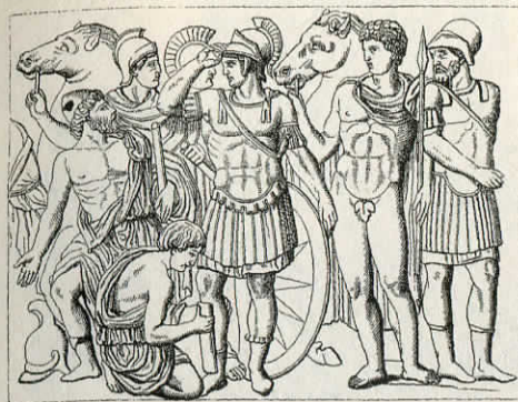
Achilas (su šarvais). Litografija. XIX a.