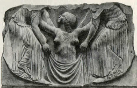
Afroditės gimimas. Reljefas. V a. pr. Kr.