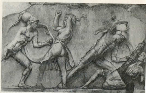
Amazonės. Halikarnaso mauzoliejaus frizas. IV a. pr. Kr.