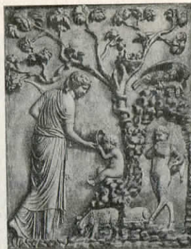
Amaltėja, mažylis Dzeusas ir Panas. II a. pr. Kr.