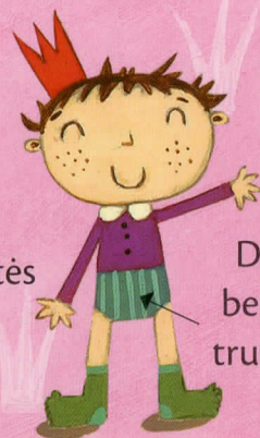
Didelio berniuko trumpikės