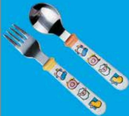
šakutė ir šaukštas