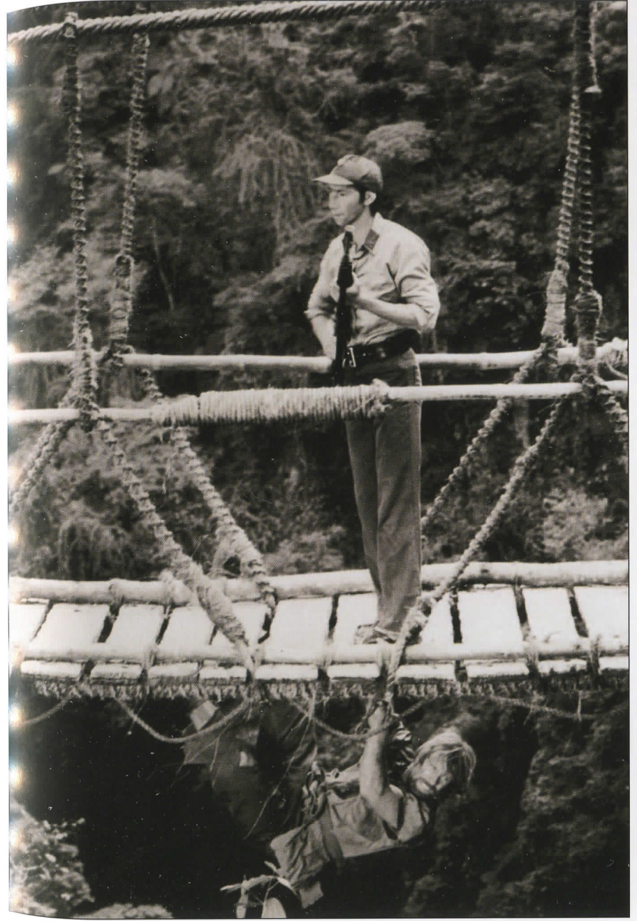
„Dingę be žinios“