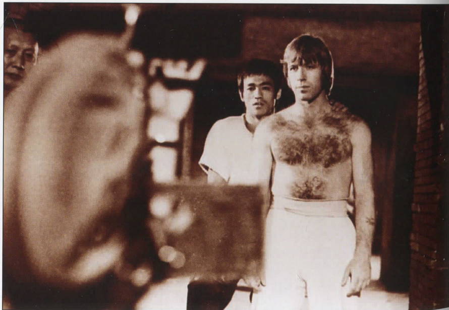
Su Bruce'u Lee aptariame „Drakono sugrįžimo“ sceną