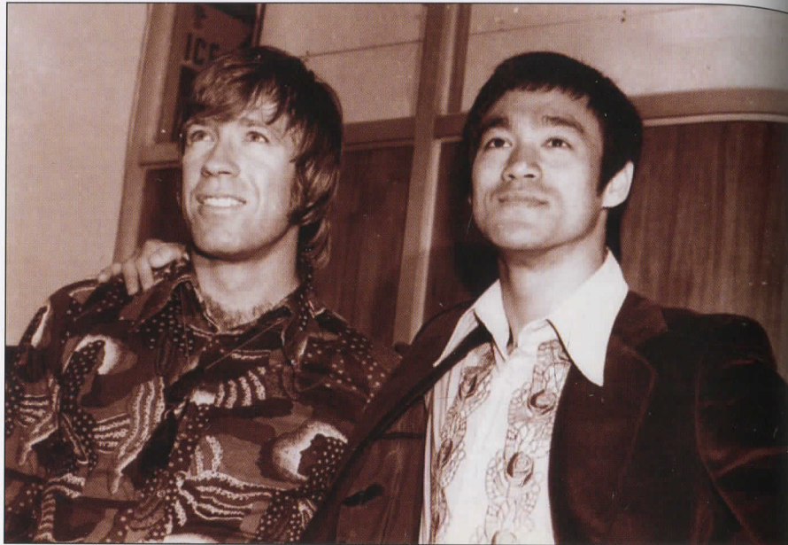
Su Bruce'u Lee prieš televizijos šou Honkonge, 1972 m.