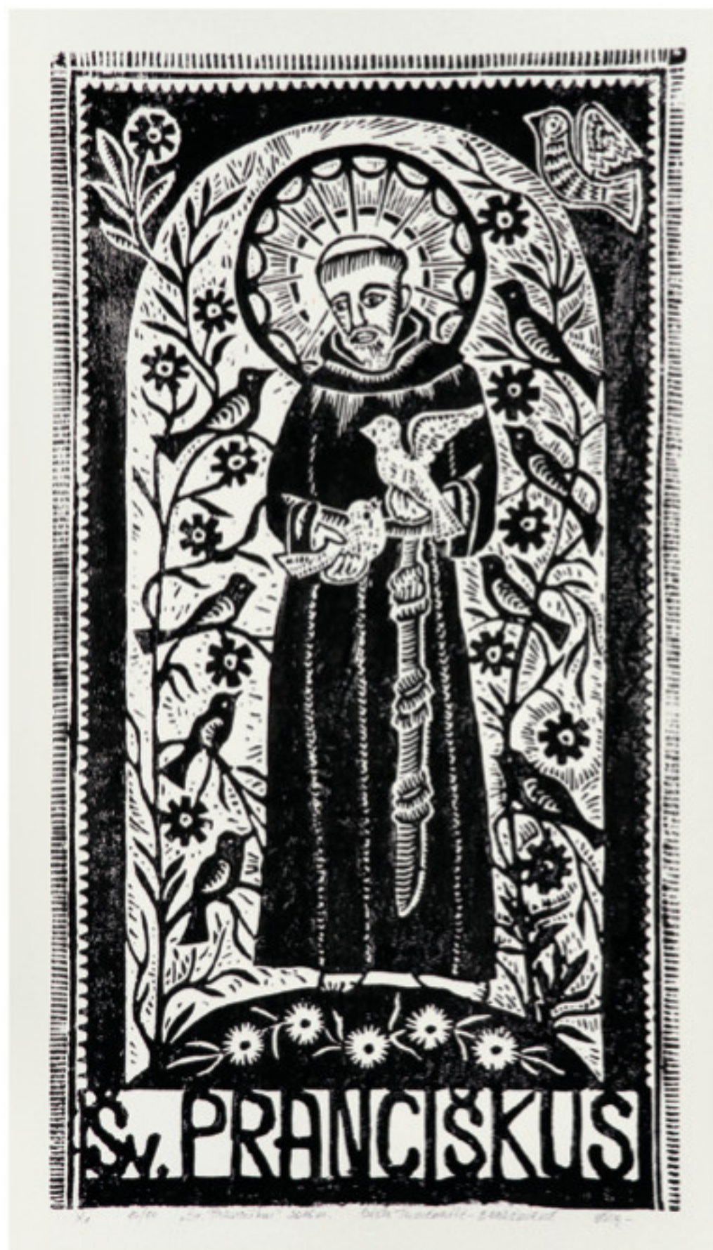
Odeta Tumėnaitė-Bražėnienė. Šv. Pranciškus , 2016 m. Medžio raižinys. 54 x 34 cm