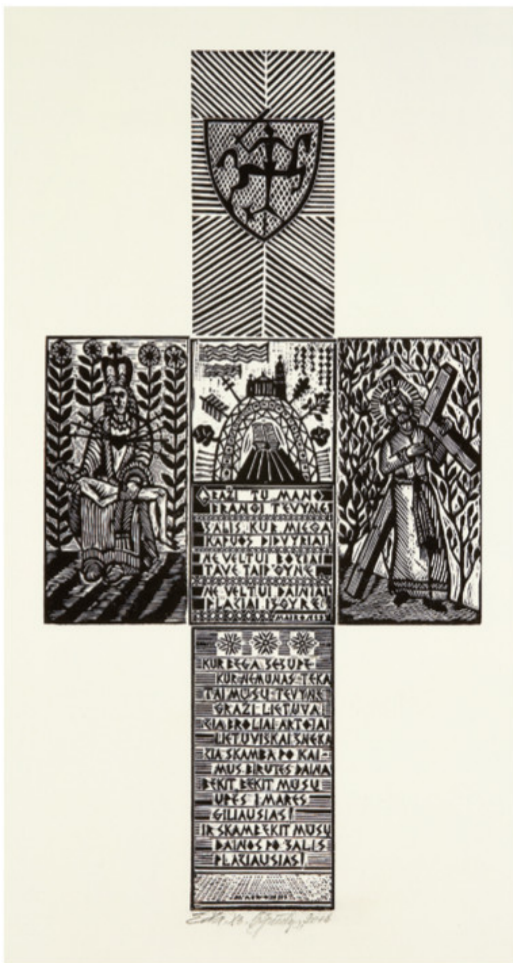
Gediminas Spūdys. Graži tu, mano brangi tėvyne , 2016 m. Medžio raižinys. 50 x 40 cm