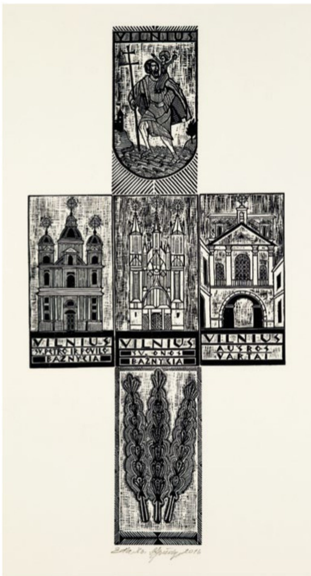
Gediminas Spūdys Vilnius, 2016 m. Medžio raižinys. 50 x 40 cm