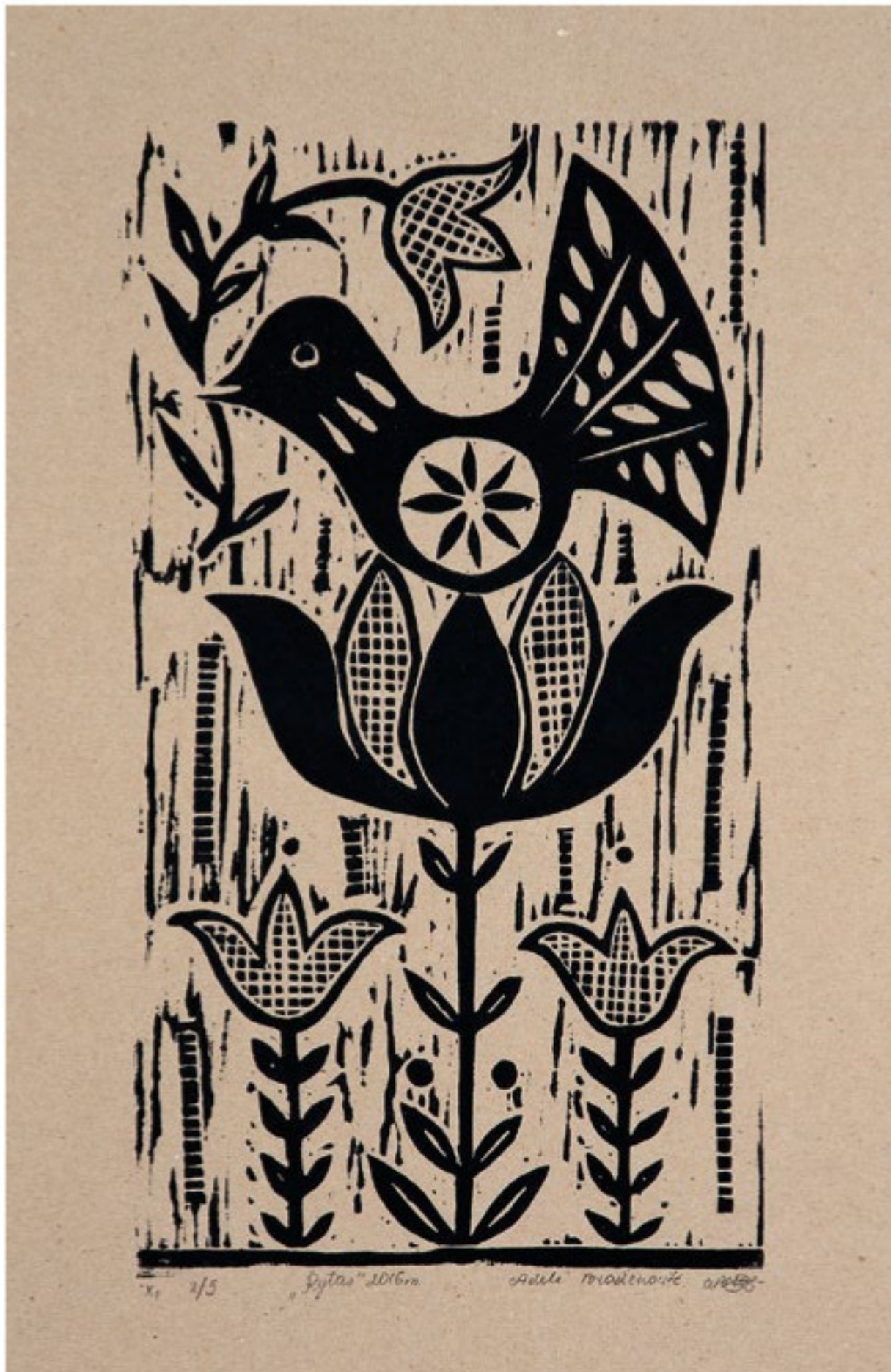
Adelė Bražėnaitė. Rytas , 2016 m. Medžio raižinys. 40 x 30 cm