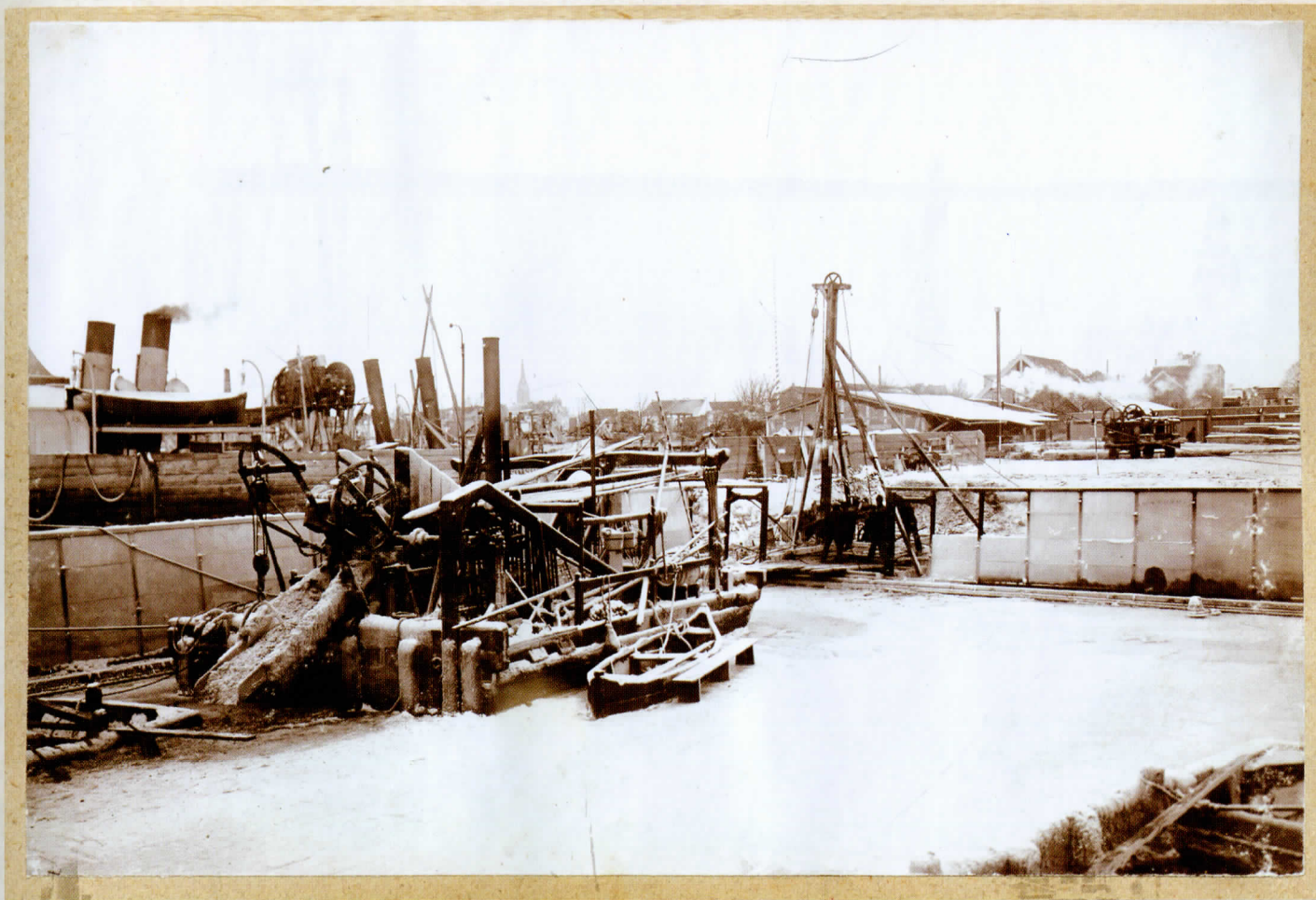
Uždaros įlankos statyba Darbų uoste (1902–1906 m.)

Construction of a closed bay in the Working Harbour (1902–1906)