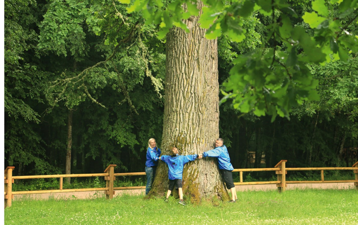
Ar pavyks apglėbti šimtametį medį?