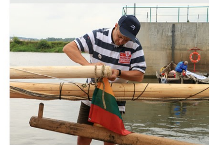
Prie ekspedicijos laivo stiebo tvirtinama Lietuvos vėliava

Profesoriaus nuomone, tai, kad Lietuvos krikštas vėlavo keletą amžių, sustabdė mūsų visų ėjimą koja kojoni su civilizacija. Antai Kijevo Rusia pasikrikštijo 988 m., len-