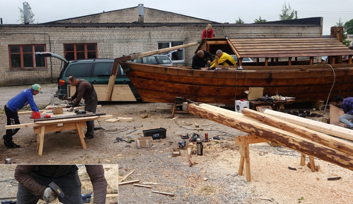
Daugybė žmonių kibo į darbą baigiant ruošti laivą nacionalinei ekspedicijai