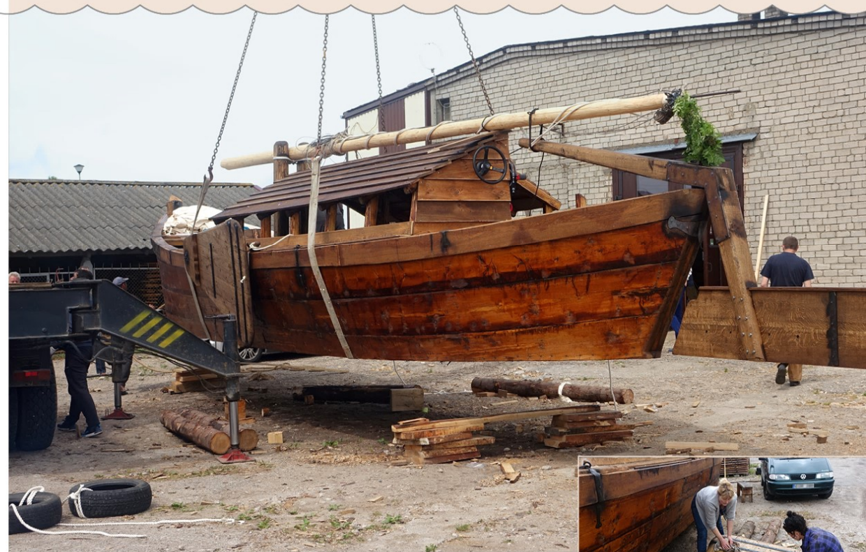
Naujas medinis vytinės tipo laivas „Vytautas Didysis“ paruoštas plaukti

daryta pakeitimų: padidintas vytinių (laivo griaučiai) skaičius, pastorintas dugnas, laivas tvirtintas ne kabėmis, o vinimis. Pasirinkta autentiška laivo statymo technologija, kai lentos bortams lenkiamos ir tuoj pat prisukamos virš laužo, foršteveniai tašomi kirviu, lentų sudūrimai obliuojami leistuvu ir obliumi, bortai dervuojami, apkaustai karšti kalami ant laivo, o sizalio virvės prie burių suvamos tiesiog adata. Variklis laivui buvo parinktas pakabinamas, tvirtinant jį viduje esančioje šachtoje. Užrašas „Vytautas Didysis“ buvo nukaltas ir išdegtas ant vainiklentės. Laivo vėjarodei – vėlukui – atkurti buvo parinkta autentiška forma, spalvos ir raidės „NE“ (nacionalinė ekspedicija). Nacionalinės ekspedicijos logotipas – Vytis ant burių, tik ne su Jogailaičių dvigubu kryžiumi, o Vytauto Didžiojo naudotais Gediminaičių stulpais, – buvo uždažytas Lenkijoje ekspedicijos metu prieš pat pradėdamas jį naudoti.