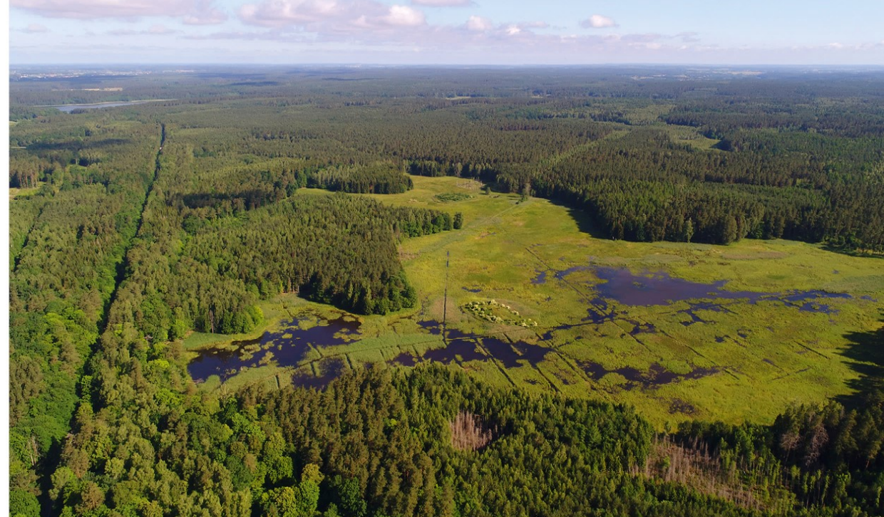
Mozūrijos aukštuma iš paukščio skrydžio

Lenkija dažnai pavadinama lygumų šalimi. Tačiau lygiai taip pat ją galima vadinti jūrine valstybe bei kalnuotu regionu. Baltijos pakrantėje yra du natūralūs jūrų uostai – Gdanskio ir Gdynės regione bei netoli Ščecino šiaurės vakarinėje šalies dalyje.