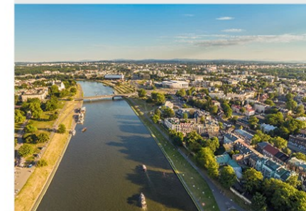
Vysla ties Krokuvu

Tatrų kalnai – aukščiausia Karpatų kalnų masyvo dalis, esanti prie Slovakijos ir Lenkijos sienos. Didžiausia Tatrų dalis yra Slovakijoje. Aukščiausia Tatrų viršukalnė – Gerlachovo viršūnė (2655 m). Tatrų kalnai labai tinka žiemos sportui, čia daug kurortų.