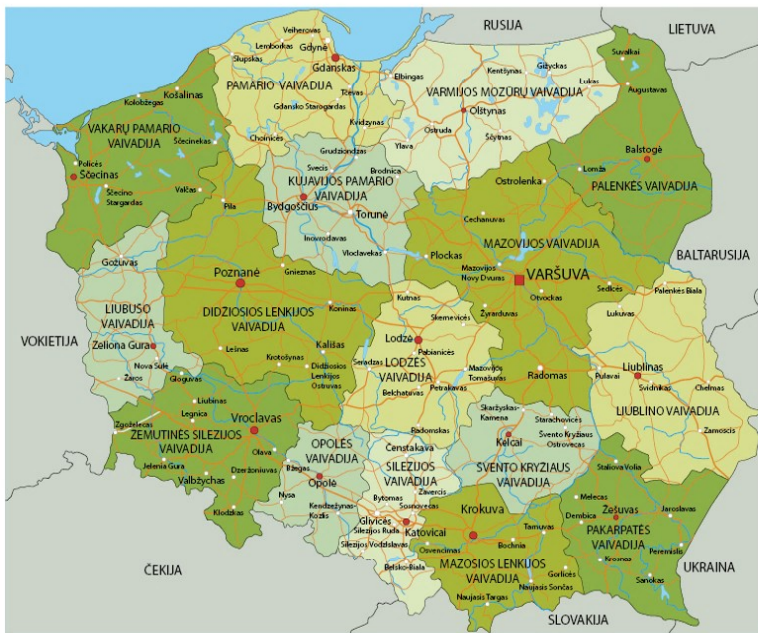
Administracinis Lenkijos Respublikos žemėlapis

Šalis tęsiasi 876 km iš šiaurės į pietus ir 689 km iš rytų į vakarus. Vidutinis šalies aukštis virš jūros lygio yra 173 m, tik 3 procentai teritorijos palei pietinę sieną yra aukščiau nei 500 m virš jūros lygio. Aukščiausia viršūnė (2499 m) – Rysai – yra Aukštuosiuose Tatuose. Apie 60 kv. km teritorijos netoli nuo Gdanskio įlankos yra žemiau jūros lygio.