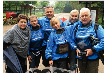
Lietingą dieną džiugiai nusiteikę nacionalinės ekspedicijos dalyviai Belovežo girioje

Kelias per Belovežo girią lietingą dieną net vasaros vidury tuščias: atrodo, kad tokiu oru čia niekas netraukia turistų. Aplink stūksantys saugomi miškai susivėrę, apsupę