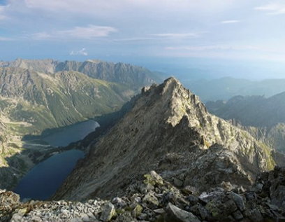
Vaizdas nuo aukščiausios Lenkijos viršūnės Tatrų kalnuose

Vidurio Europoje, tarp Baltijos jūros ir Karpatų kalnų, plyti Lenkija – didžiausia šio regiono valstybė. Pietuose ji ribojasi su Slovakija, pietvakariuose – su Čekija, pietryčiuose – Ukraina, rytuose – Baltarusija, šiaurės rytuose – Lietuva ir Rusija (Kaliningrado sritimi), vakaruose – Vokietija. Šiaurėje driekiasi 440 km Baltijos jūros pakrantė, sausumos sienų ilgis – 3528 km. Pagal plotą (312 685 kv. km) Lenkija yra 9 šalis Europoje ir 63 pasaulyje. Lenkijoje gyvena apie 38,58 milijono gyventojų. Apie 20 milijonų lenkų gyvena pasklidę visame pasaulyje.