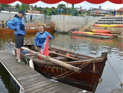
Lomžos uoste nuleisti laivai pasiruošę išplaukti