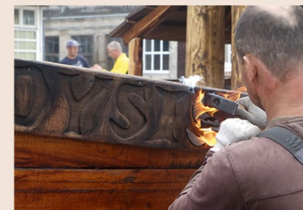
Ant vainiklentės išdeginamas užrašas „Vytautas Didysis“