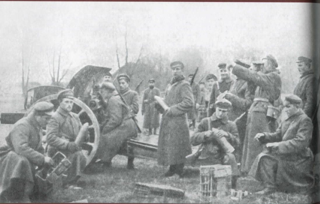
Lietuvos kariuomenės artileristai pozicijoje prie 105 mm kalibro 1898–1909 m. modelio Kruppo modelio lauko haubicos, 1919 m.